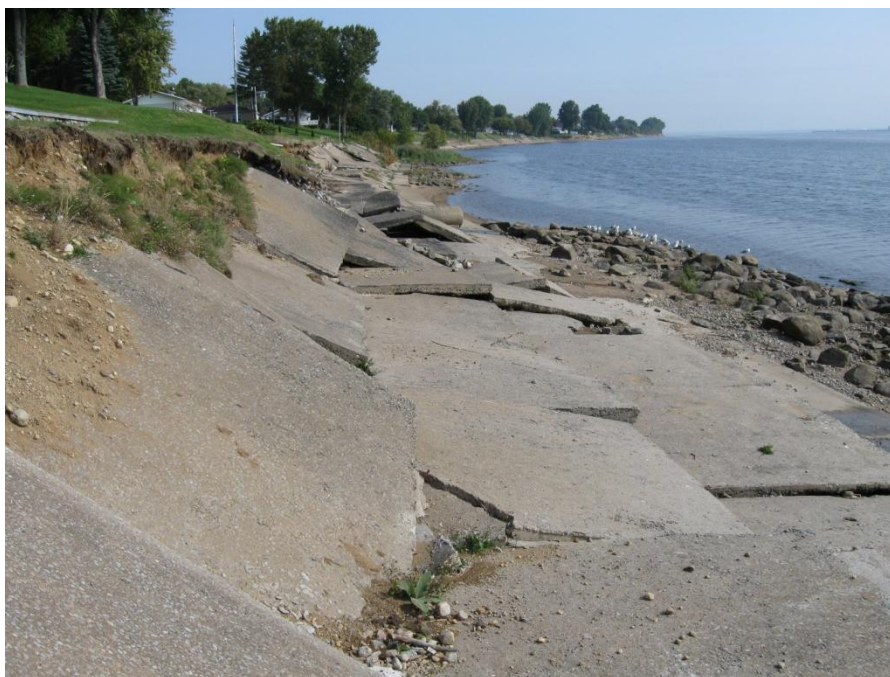
Figure 2 : Érosion Ville de Trois-Rivières (secteur Sainte-Marthe-du-Cap)