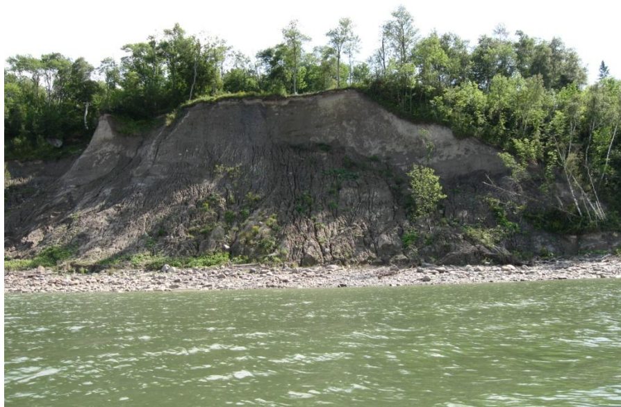
Figure 3 : Érosion Cap-Charles – Deschaillons-sur-Saint-Laurent